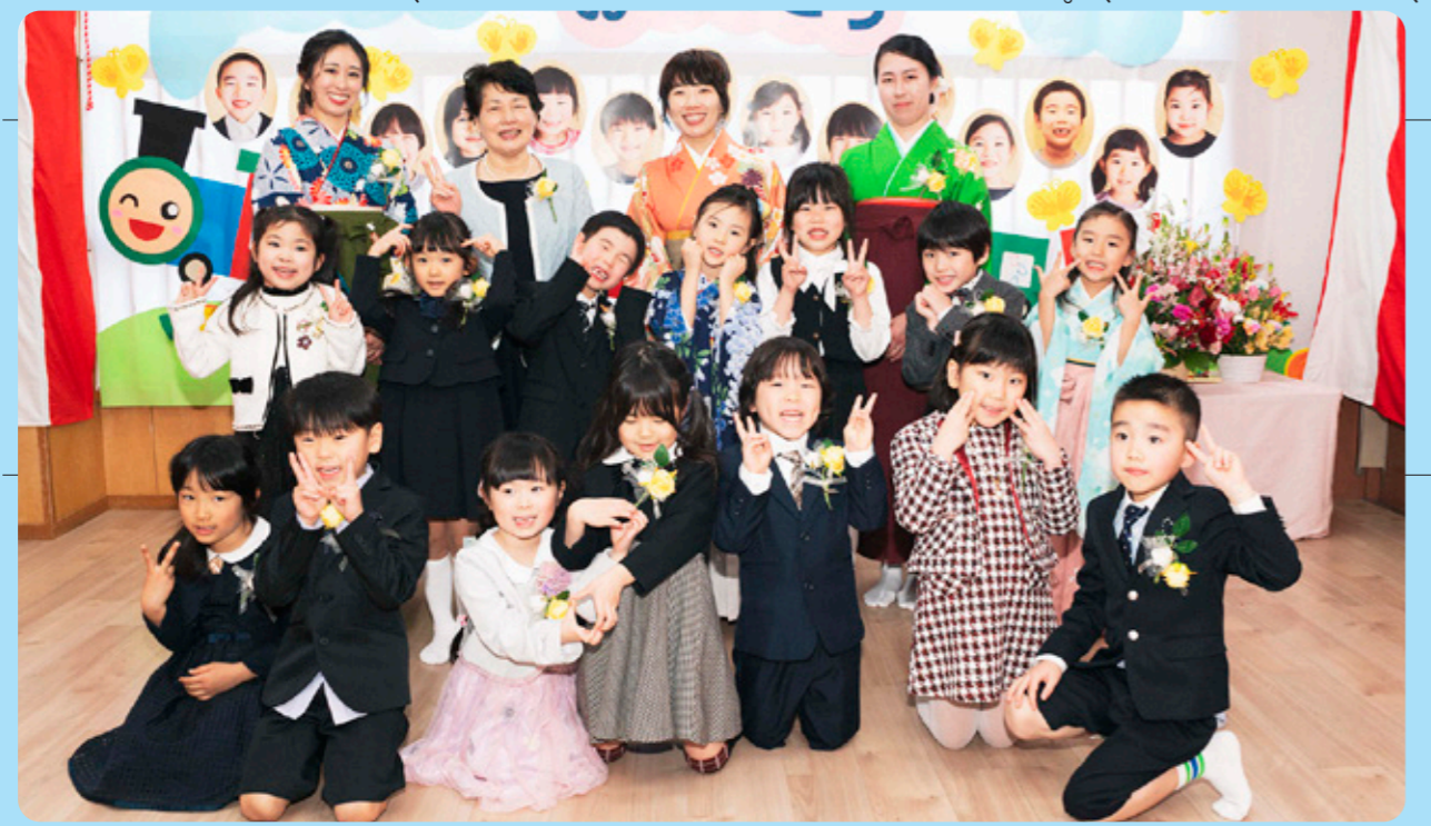
それを保護者の方へと渡す姿はとても立派で、感動の瞬間でした。 卒園児紹介では、将来の夢にまつわるものや得意なこと、好きな事を活かして作った作品を自分の言葉で紹介し、作品を持って花道を歩き、披露しました。紙粘土を使って動物や食べ物を作ったり、針と糸を使って縫い物を作ったり、空き箱をリサイクルしてロボットを作ったりと個性が光る素敵な作品を堂々と発表し、時には「おおーすごいねー」と歓声が上がること。最後は「ありがとうさようなら」「ずっと一緒に」の歌を歌い、会場は感動の涙と笑顔でいっぱいでした。 四月からはついにピカピカの一年生として小学生の仲間入り！ランドセルを背負った姿は

卒園児紹介では、将来の夢にまつわるものや得意なこと、好きな事を活かして作った作品を自分の言葉で紹介し、作品を持って花道を歩き、披露しました。紙粘土を使って動物や食べ物を作ったり、針と糸を使って縫い物を作ったり、空き箱をリサイクルしてロボットを作ったりと個性が光る素敵な作品を堂々と発表し、時には「おおーすごいねー」と歓声が上がること。最後は「ありがとうさようなら」「ずっと一緒に」の歌を歌い、会場は感動の涙と笑顔でいっぱいでした。 四月からはついにピカピカの一年生として小学生の仲間入り！ランドセルを背負った姿は