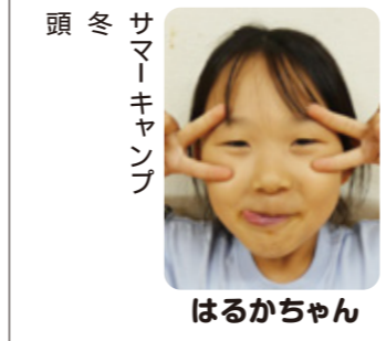
頭冬 サマーキャンプ はるかちゃん